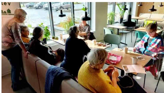
Aktiviteter i Fællesskabet 8462

"Årsagerne til fremmøde er forskellige, men det at lære nye mennesker i nærmiljøet at kende gennem hyggeligt samvær og at få lov til bare at være nævnes af flere," udtaler Rikke Sort Buchtrup, der ligeledes påpeger, at hun selv og andre også nyder at få ny og gensidig inspiration til kreative gøremål i fællesskabet.