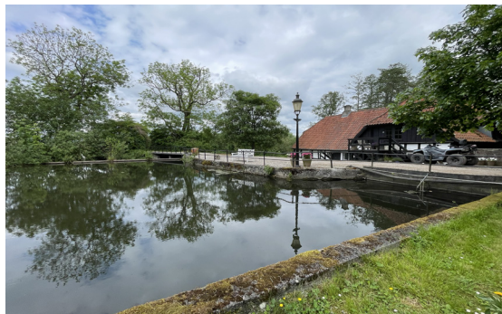
Tarskov Mølle

Der må have været et summende liv og mennesker omkring gården og måske også på vejen de få hundrede meter hen til Harlev Mølle.