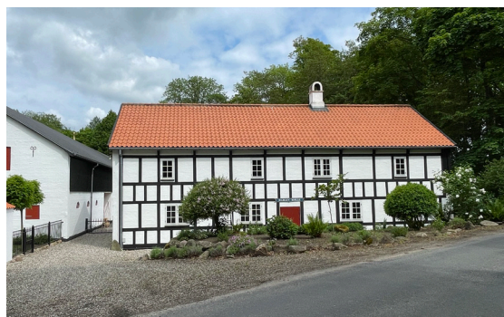
Harlev Mølle

Det tog mange hundrede år at udvikle de effektive møller, der førte til store møllegårde som Tarskov og Harlev Mølle. I dag står de fredede og omgivet af ro, men engang har der været et leben af mennesker, der levede her eller kom for at få malet korn.