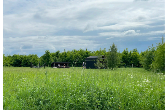
Shelterpladsen ved Åbo Skov

aldrig, så møllen gik videre til nye slægter. Fra Harlev Mølle kan man fortsætte turen til Åbo Skov, hvor man ikke behøver være så ekstra opmærksom på trafik!