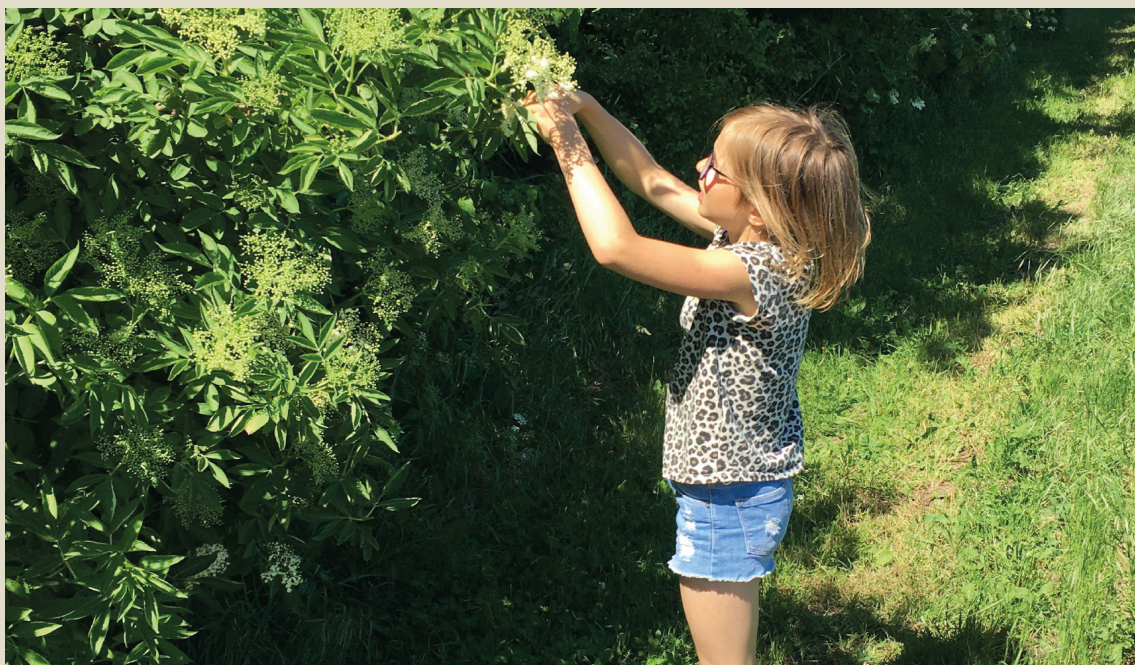
Sommer i Harlev