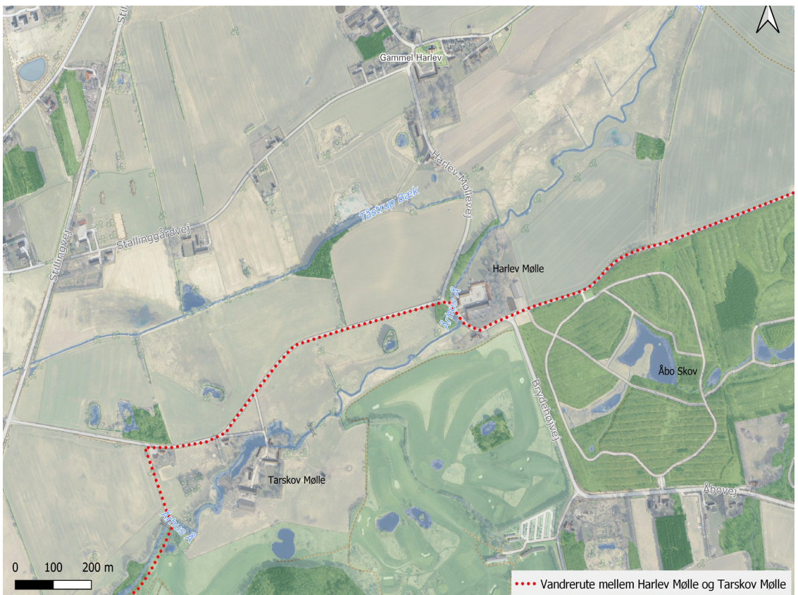
Vandrekortet er udarbejdet af Sol Strømbo Hansen