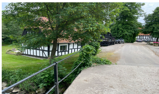
Tarskov Mølle

Harlev Mølle havde ifølge folketællingen i 1880 også 23 beboere. Her var der dog ikke nogen stor børneflokk, men ud over ejeren og hans husbestyrerinde en mængde ansatte – blandt andet en mejeribestyrer, en gartner, en stuepige, fire tjenestepiger, karle og røgttere foruden møllersvenden.