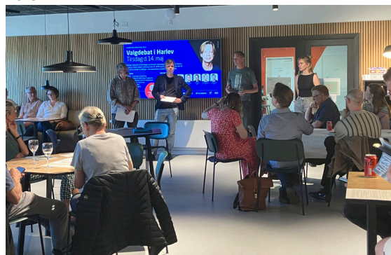
Europa Parlaments valgdebat i Harlev Idræts- og Kulturcenter