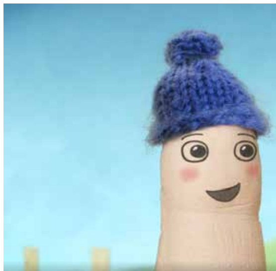
Film for de mindste. Billede: Lillefinger.

Filmvisningen varer i alt ca. 30 minutter, bagefter kan der kigges i og lånes bøger, som er udvalgt til dagens tema og de figurer, der har været i dagens film.