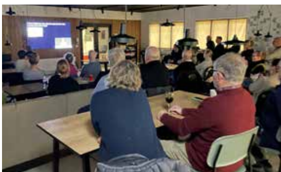
Livestream aften i Café Harlev

Frivillige holder Cafe Harlev åbent under foredraget for salg af drikkevarer og kaffe/kage, så der er gode muligheder for at få en fællesskabende og horisontudvidende oplevelse. Livestreams er for alle, der er fri entre, og det er et godt alternativ til en "almindelig" tirsdag aften derhjemme.