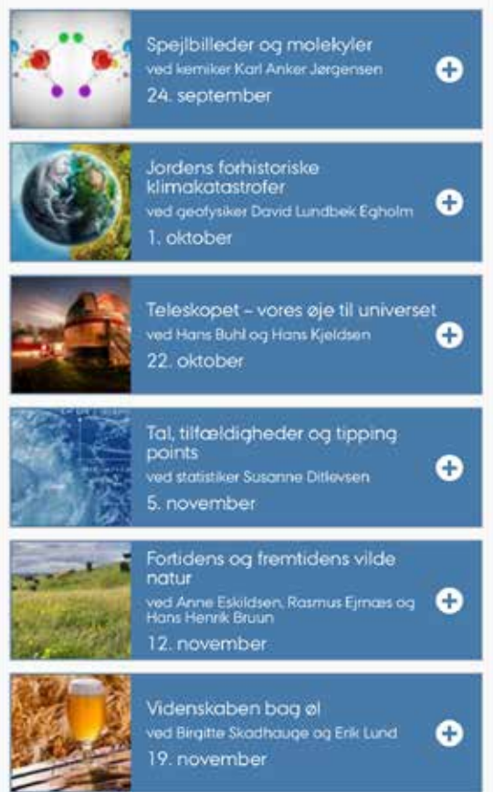
Billede: Oversigt med livestream fra Aarhus Universitet