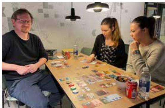
Brætspil Café Aften

Se mere information på facebook siden for "Harlev brætspilscafe" og www.hiogk.dk