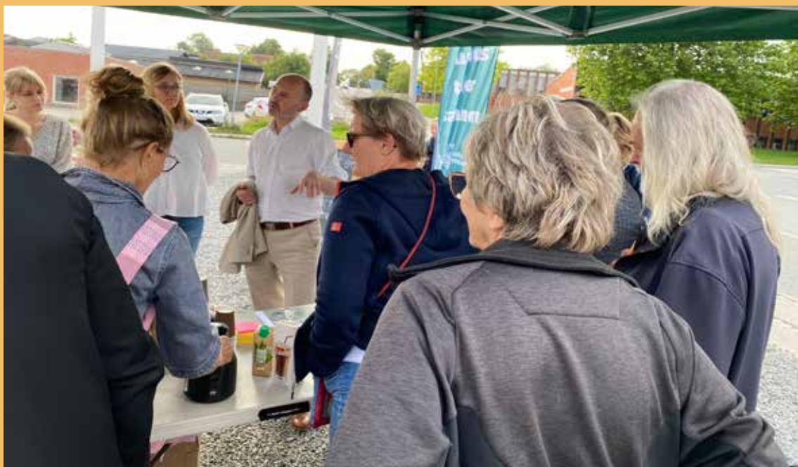
Rådmanden på besøg i Harlev.

Nyt fra Harlev-Framlev Grundejerforening