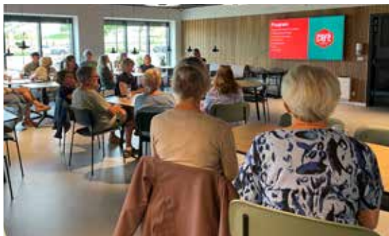
Livestream aften i Café Harlev

En ny sæson står for døren for Århus Universitets livestream og FællesSkaberne åbner vanen tro dørene op for hyggelige og lærerige foredrag i Harlev Idræts- og Kulturcenter. Sæsonen for efteråret 2024 består af 6 livestream, som byder på et varieret indhold af naturvidenskabelig karakter. Foredragene er fastlagt til tirsdage - se datoer og indhold i overblikket "Foredrag efterår 2024".