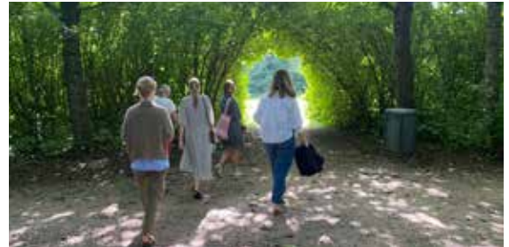
Gåtur med kulturforvaltningen

masser af ny viden om vores område og med indtrykket af en aktiv by, som er villig til at indgå i dialog, men som også forventer handling.