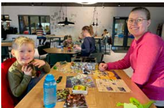
Brætspil Café Aften