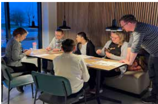
Brætspil Café Aften