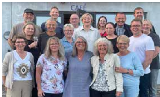
Et udpluk af de frivillige i Cafe Harlev, hvor der i ny og næ laves infomøder og hyggearrangementer for de frivillige.