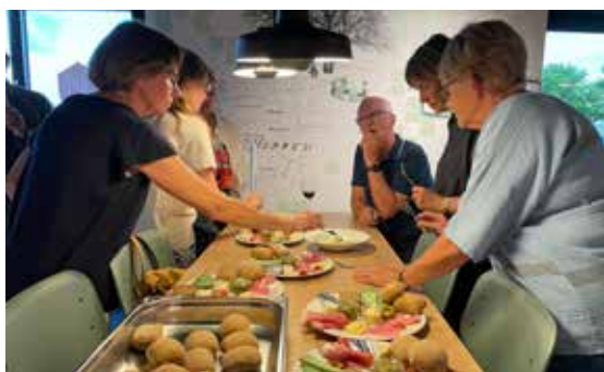
Frivillige i Café Harlev forbereder tapas tallerken